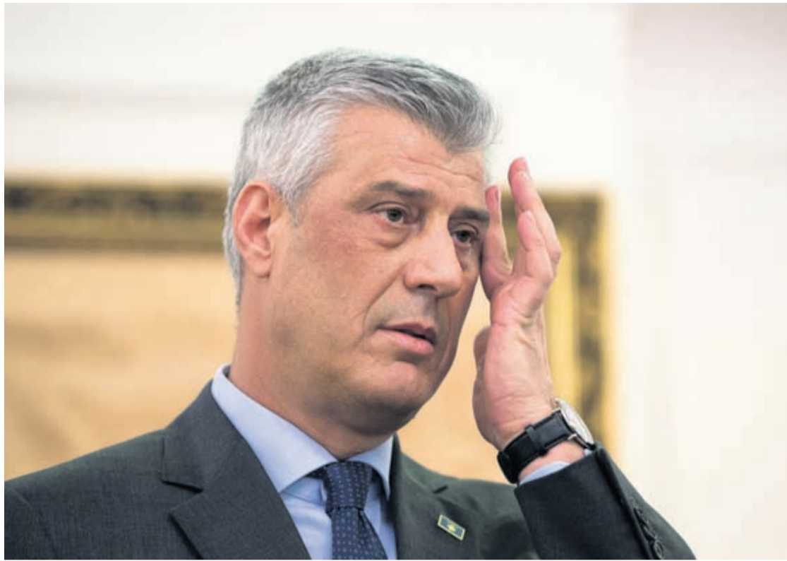
In this Monday, Jan. 21, 2019 file photo, Kosovo president Hashim Thaci gestures during a press conference in Kosovo capital Pristina.

A statement from the prosecutor of the Kosovo Specialist Chambers said Thaci and the nine others "are criminally responsible for